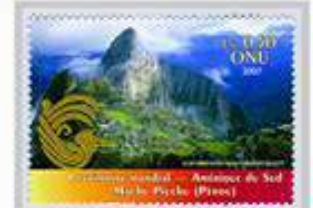
La UNESCO es una de las Naciones Unidas organismo especializado de preservar y dar a conocer sitios de valor cultural importancia a la común patrimonio de la humanidad.