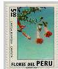
Cantuta, Flor Real de los Incas