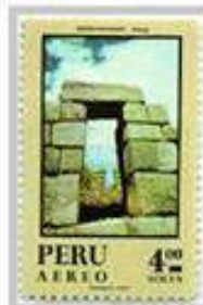
Construcción de Templos

Para realizar esta impresionante obra, los incas necesitaron una gran fuerza de trabajo y aprovecharon la forma de tributo conocida como la "Mita" para llevarla a cabo, el estado Inca lo utilizaba para: