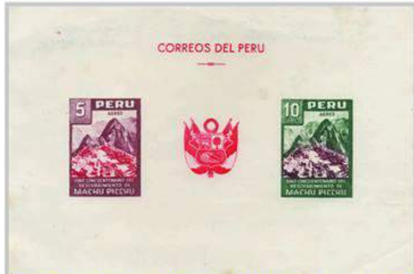
Perú 1961, Error de placa. Existe una línea roja adicional junto a "DE" en el segundo párrafo del valor de 5 soles. Publicado por el 50 aniversario del descubrimiento, era válida para un día y se vendió de manera restringida.

Es un símbolo de la creatividad y la integración con el medio ambiente de los pueblos andinos que ayuda a los peruanos a conectarse con el orgullo de su pasado y crea una de las ideas más arraigadas de la identidad nacional.