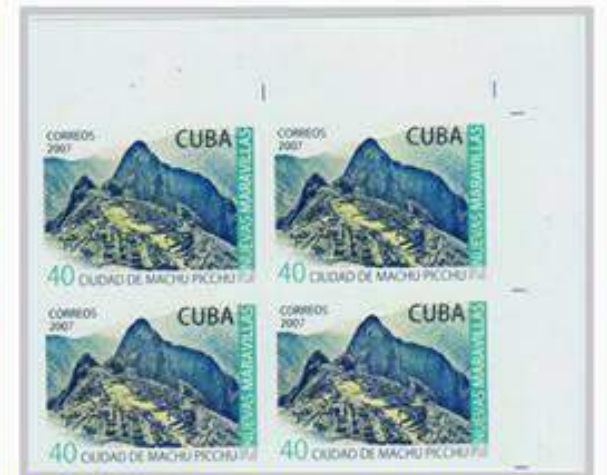
Cuba 2007, Prueba en bloque de 4 valores sin perforar por Coprefil

Al conocerse los resultados el 7 de julio y estar en la lista final, el presidente de Perú declaró esa fecha como el día de Machu Picchu.