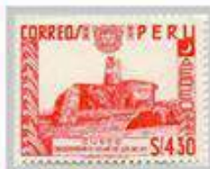
Perú 1962, una de las pocas sellos peruanos con filigrana.