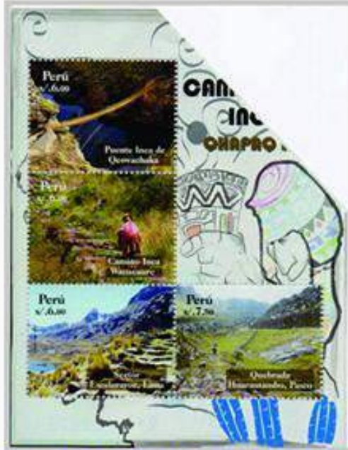
Perú 2009. Un pequeño lote de estas hojas souvenir fueron emitidas solo por pocos días antes de ser regresadas a la oficina principal de correo debido a problemas de derechos de autor por el chamán en la viñeta.