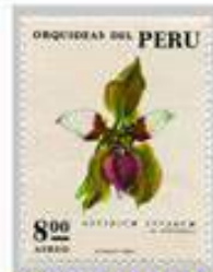
Perú 1973, Error de color por superposición del azul.