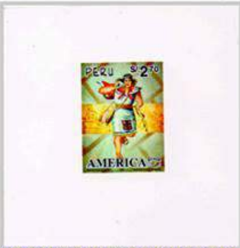
Perú 1997, Prueba Papel Grueso Thomas Greg & Son Peru S.A.

La verdadera aventura es recorrer a pie el Camino Inca, una ruta exigente de 4 días donde las espectaculares vistas del paisaje andino se conservan tal como lo veían los chasquis,