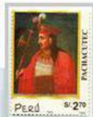
Perú S/ 270

Para celebrar la victoria sobre los Chancas, los enemigos más difíciles que tuvieron los incas. El 9no Sapa Inca Pachacútec empieza así la Era Imperial, iniciando la construcción de su palacio sobre las nubes, una obra impresionante de ingeniería y arquitectura; donde descansar y entrar en comunión con el entorno para rendir culto a sus dioses.