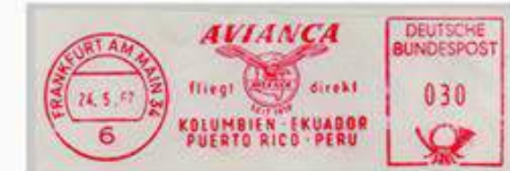
Alemania 1967, Matasello Parlante de la máquina Franqueadora Na8. Postalia con el texto "Vuelos directo VÍA CÓNDOR" de la aerolínea AVIANCA.