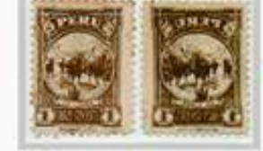
Perú 1931, Error en la imagen impresa en reverso (espejo)