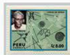
Las Lineas de Nazca