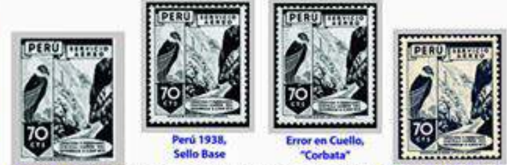
Perú 1938, Sello Base Error en Cuello, "Corbata" Variedad Papel India