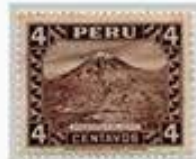
La Tierra, las Montañas y el Agua también eran importantes cultos.