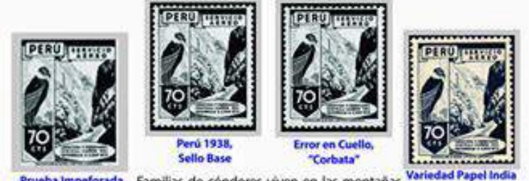
Perú 1938, Sello Base. Error en Cuello, "Corbata". Variedad Papel India. Prueba Impeforada. Familias de cóndores viven en las montañas cercanas y observan desde la distancia el sitio.