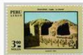
Perú 1970, MUESTRA Chan-Chan

El Perú ha sido el hogar de antiguas culturas que dejaron restos arqueológicos que perduran hasta nuestros días y son centro del turismo.