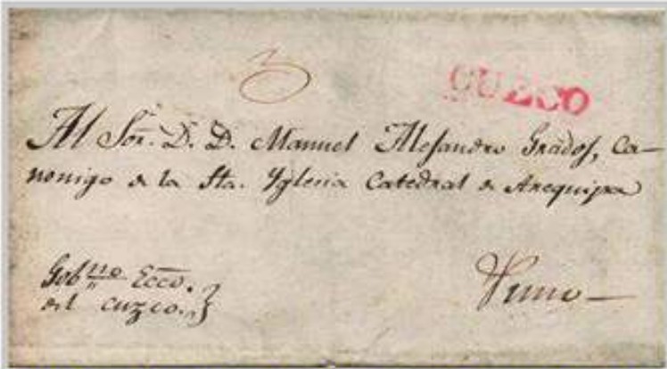
Perú 1836, Marca Postal CUZCO (identificado por los puntos alrededor) Transitó por la Carrera de Cuzco, en el segmento Cusco-Sicuani-Puno recorriendo 75 leguas (362 kms.) por un porte de 3 reales.

La ciudad del Cusco fue la capital del imperio Inca. Actualmente coexisten la arquitectura inca con la colonial hispánica y edificios modernos. Sus habitantes son gente cosmopolita y algunos cusqueños aún conservan sus tradiciones en sus trajes típicos y costumbres.