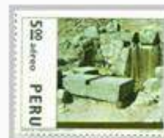
Existe una cantera en la cima de la ciudadela, con grandes piedras en proceso.