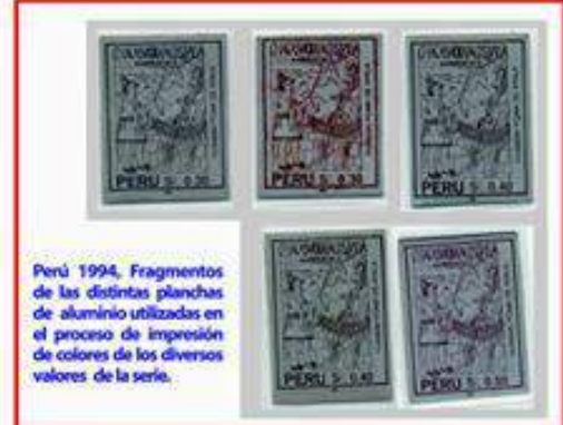
Perú 1994, Fragmentos de las distintas planchas de aluminio utilizadas en el proceso de impresión de colores de los diversos valores de la serie.