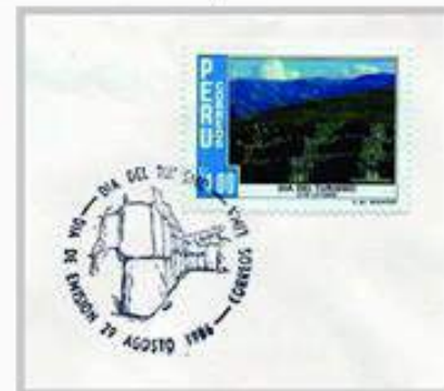
Construcción de Fortalezas