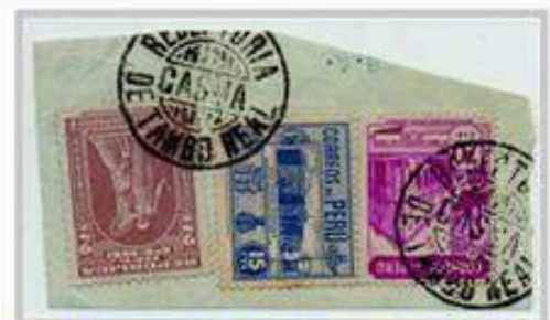
Perú 1951. Fragmento de sobre de porte 35 ctvs (+2 de prodesocupados) para porte local, matasello de la receptoría de TAMBO REAL, Oficina Principal de CASMA-Ancash. Las receptorías eran oficinas postales que hasta 1980 que estaban localizadas en poblaciones pequeñas que al crecer el número de habitantes se transformaba en Oficinas Sub-principales

Eran almacenes en donde se guardaban los recursos necesarios para el funcionamiento de la ciudadela. Estos recintos con techo a dos aguas, alojaban a los mitimaes (colonos obligados a vivir allí) que atendían la ciudadela y sus los visitantes, así como a los mensajeros incas (chasquis)