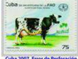
Cuba 2007, Error de Perforación Desplazada