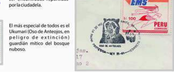
El más especial de todos es el Ukumari (Oso de Anteojos, en peligro de extinción) guardián mítico del bosque nuboso.

Es el hogar de raras orquídeas, revoloteantes aves y mariposas que los Incas supieron apreciar y en este contacto con la naturaleza descubrieron las propiedades medicinales y rituales de la Cantuta, flor nacional del Perú. También es el hogar de el Tunki ó Gallito de las Rocas, ave nacional del Perú.