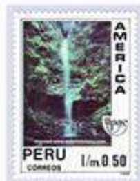
PERU 1/m 0 50