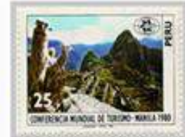
Las llamas también pueden ser encontradas repartidas por la ciudadela.