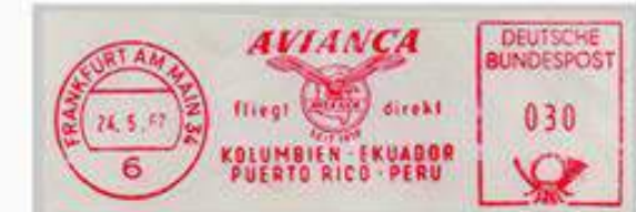
Alemania 1967, Matasello Parlante de la máquina Franqueadora Na8. Postalia con el texto "Vuelos directo VÍA CÓNDORES" de la aerolínea AVIANCA.