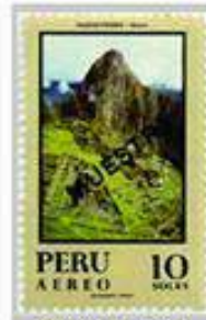
Perú 1970, Muestra