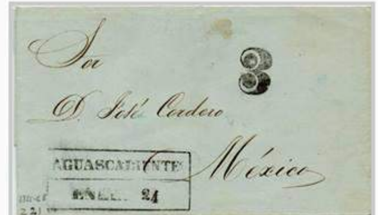
México 1855, Marca Postal AGUASCALIENTES enmarcada en una caja. El sobre recorrió desde ciudad de Aguascalientes por 53 leguas (250 kms.) hasta Ciudad de Mexico por un porte de 3 reales.

Desde Aguas Calientes, se puede ascender a la caminando 1 hora a pie ó en 15 minutos en autobús.