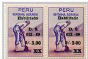
Perú 1969, Esta serie no se ha emitido sin recargo. Error en el valor nominal de " Movido encima de la marca del separador decimal.