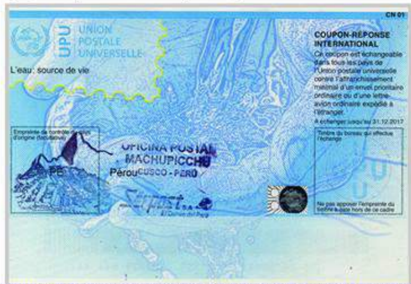
Perú 2016, Cupon de Respuesta Internacional con matasello Machu Picchu de la oficina postal de Aguas Calientes.

El diseño de la ciudadela permitían aprovechar la geografía e integrar la construcción con el medio ambiente. Por su ubicación en ceja de selva, llueve durante todo el año y es necesario canalizar el agua para su uso y distribución en andenes y en los templos dedicados al este valioso recurso.