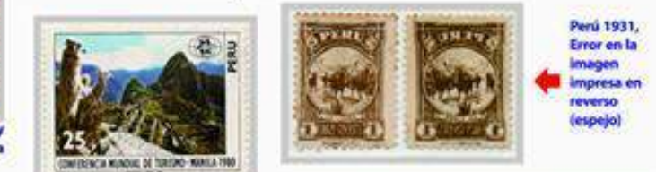
Perú 1931, Error en la imagen impresa en reverso (espejo)