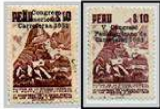
Perú 1951, Error de desplazamiento en el resello. Ter sello peruano que representa Machu Picchu.

Una pequeña montaña llamada Huchuy Picchu (montaña pequeña) detrás Intihuatana es mi punto de partida.