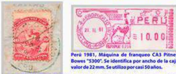
Perú 1981, Máquina de franqueo CA3 Pitney Bowes "S300". Se identifica por ancho de la caja valor de 22 mm. Se utilizó por casi 50 años.