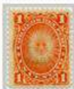
Adoraban al Sol como deidad protectora