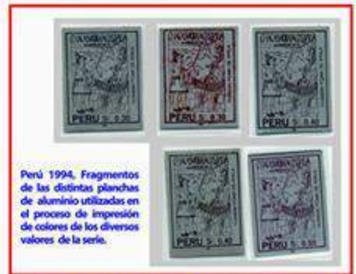
Perú 1994, Fragmentos de las distintas planchas de aluminio utilizadas en el proceso de impresión de colores de los diversos valores de la serie.

Al caminar 20 minutos al oeste me encontré con el famoso "puente removible" cuya función era cerrar el paso a visitantes indeseados y conecta el sendero que desciende hasta el río Urubamba.