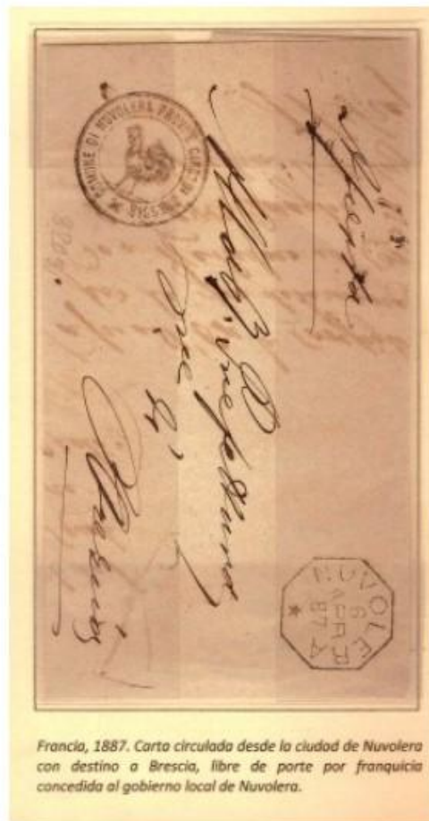
Francia, 1887. Carta circulada desde la ciudad de Nuvoiera con destino a Brescia, libre de porte por franquicia concedida al gobierno local de Nuvoiera.

Las marcas administrativas que no respondan a una tarifa o a un requerimiento relacionado con el correo.