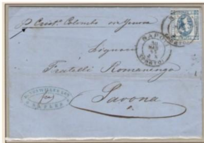
Nombre del barco