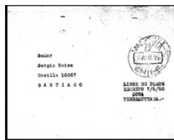
Carta enviada desde Valdivia, 13 de Junio 1960 a Santiago, donde se recibió el 15 de Junio. El remitente escribió a máquina: "Libre de porte/ Decreto 7/6/60 / Zona/ Terremoteada."

La solidaridad internacional con esta desgracia se materializó en dos emisiones postales. El 10 de septiembre de 1960, Argentina emitió dos sellos con sobretasa a favor de los damnificados por el terremoto. Estos sellos (Mi 742 y 743) muestran la flor nacional de Argentina, el ceibo, en el valor de 6 + 3 $ y el copihue chileno en el valor de 10.70 + 5.30 $. El tirada fue de 700.000 series.