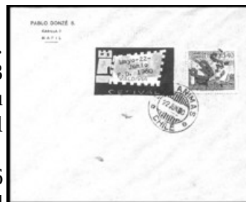
Sobre con logo de CEFIVAL con el sello de $ 40 Exposición Filatélica sobrecargado S.O.S. Fechador circular de Las Animas 22 Jun 60. Sin circular.

La Dirección General de Correos dictó el 27 de julio de 1960 la circular Postal C. 1 N° 72, por la que solicitó a las oficinas postales rechazar toda correspondencia u objeto postal franqueado con estas estampillas no autorizadas ( Chile Filatélico N° 139, pp. 372-373. )