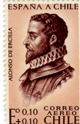
cat CHILE2006 # 647