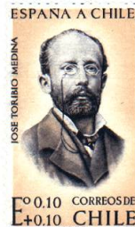
cat CHILE2006 # 646