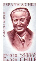
cat CHILE2006 # 648