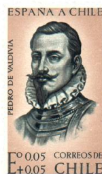
cat CHILE2006 # 645