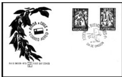
sellos de Argentina, (Mi 742 y 743)

valores ordinarios de 5+5 c Pedro de Valdivia y 10+10 c José Toribio Medina (645/646, Yv 289-290; Mi 596/597) tuvieron un tiraje de dos millones de ejemplares y los aéreos 10+10 c Alonso de Ercilla y 20+20 c Gabriela Mistral (647/648; Yv. 205-206; Mi 598/599) una emisión de tres y cuatro millones de unidades, respectivamente. La sobretasa fue tan elevada que significó el pago del doble del franqueo, por lo que no tuvieron la aceptación esperada. Esta serie aparece con los números 645 a 648 del Catálogo Especializado de Chile. Debido a la escasa venta inicial, se eliminó la sobretasa autorizando su uso como franqueo por la totalidad del valor, incluyendo el monto de la sobretasa a partir del 16.11.1962. Emitidos el 29.04.61.