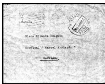
Sobre enviado desde Valdivia a Santiago el 2 de junio de 1960, con recepción en la capital el 23/06.