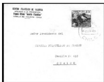
Sobre enviado del Centro Filatélico de Valdivia al Círculo Filatélico de Curicó, franqueado con el 3 $ Cuarto Centenario de Valdivia, sobrecargado S.O.S. en diagonal. Despachado el 1 de Julio de 1960, recibido en Curicó el 4 de Julio.

La correspondencia no filatélica hacia el resto del país usualmente no lleva marcas especiales. Se distinguen por el timbre fechador de origen y no llevan sellos postales adheridos. En otras ocasiones, los remitentes hacían constar en forma manuscrita o a máquina que la correspondencia era liberada de porte.