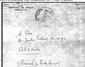
Sobre enviado desde Ancud (Isla de Chiloié) al caserío de Alcones, en el ramal del ferrocarril a Pichilemu, el 12 de junio de 1960. Marca de tránsito San Fernando, 28 de Junio.

La correspondencia no filatélica hacia el resto del país usualmente no lleva marcas especiales. Se distinguen por el timbre fechador de origen y no llevan sellos postales adheridos. En otras ocasiones, los remitentes hacían constar en forma manuscrita o a máquina que la correspondencia era liberada de porte.